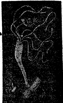
Ἐν τῷ ὄστρειδίῳ, εἶδος ὀλιγώτερον ζῶον, τὸ ὄστρειδίον.

Θεωρήσατε νῦν, ἕτερον ζῶον ὅπερ ἔχει ὀλιγώτερα ὄργανα τοῦ ὄστρειδίου, τὴν ὕδραν. Εἶναι λίαν μικρὸν ζῶον εὐρισκόμενον ἐν λίμναις και προσκολλώμενον ἐπὶ ἀχύρου ἢ ξύλου διὰ τοῦ ἐκμυζῆτικου αὐτοῦ στόματος.